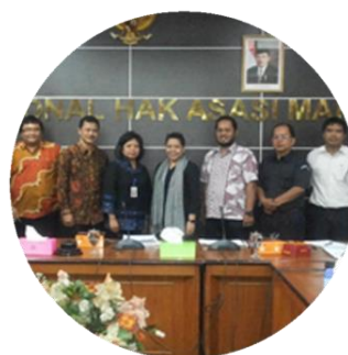
Advokasi dan Konsultasi JFAK di K/L/Pemda