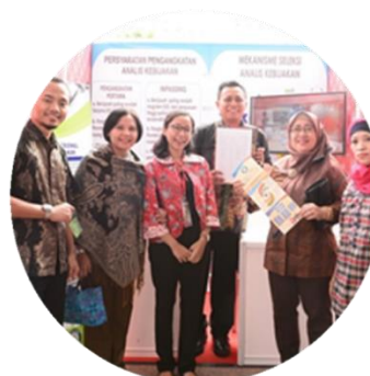
Partisipasi PUSAKA LAN dalam Expo Jabatan Fungsional Tertentu yang diselenggarakan oleh Kemendagri