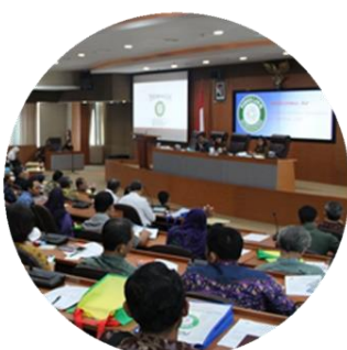
Workshop Advokasi JFAK