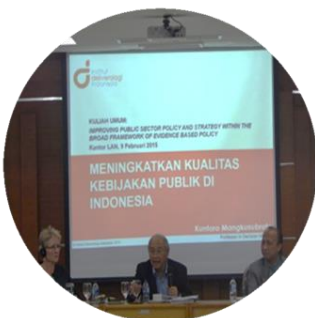
Public Lecture Upaya Meningkatkan Kualitas Kebijakan Publik di Indonesia